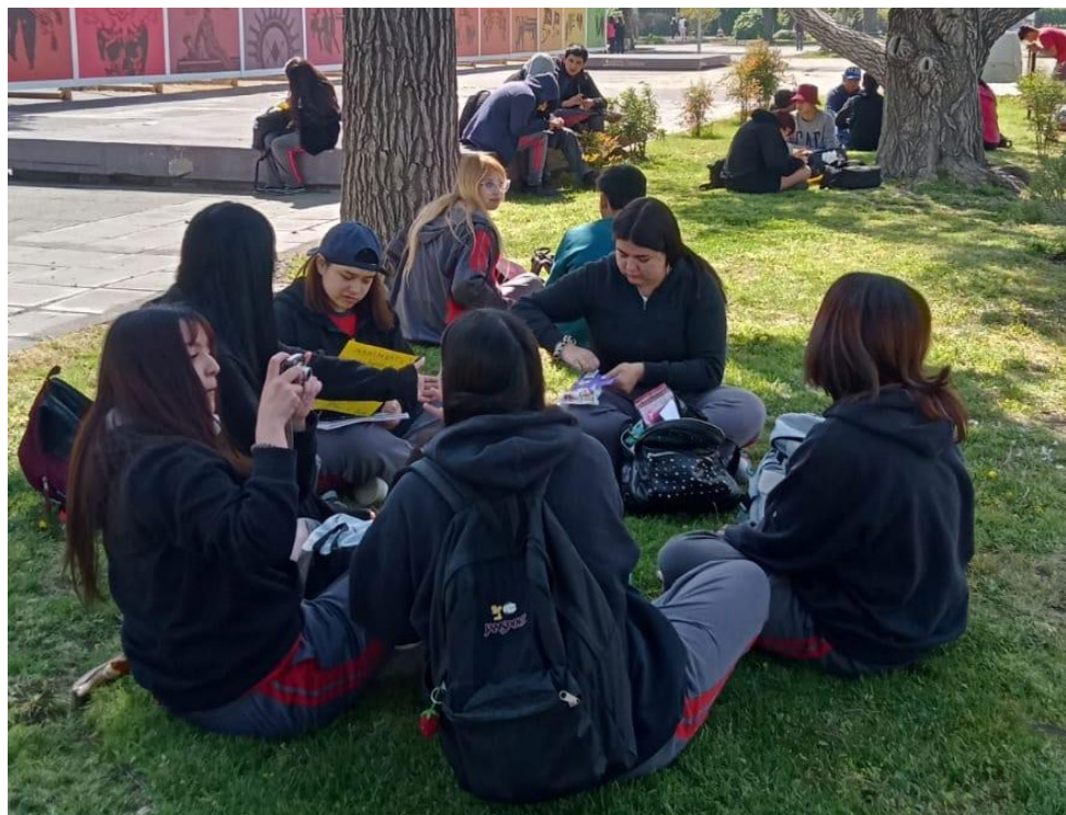
Figura 1. Salida pedagógica a exposición: "Por la vida...¡Siempre!".