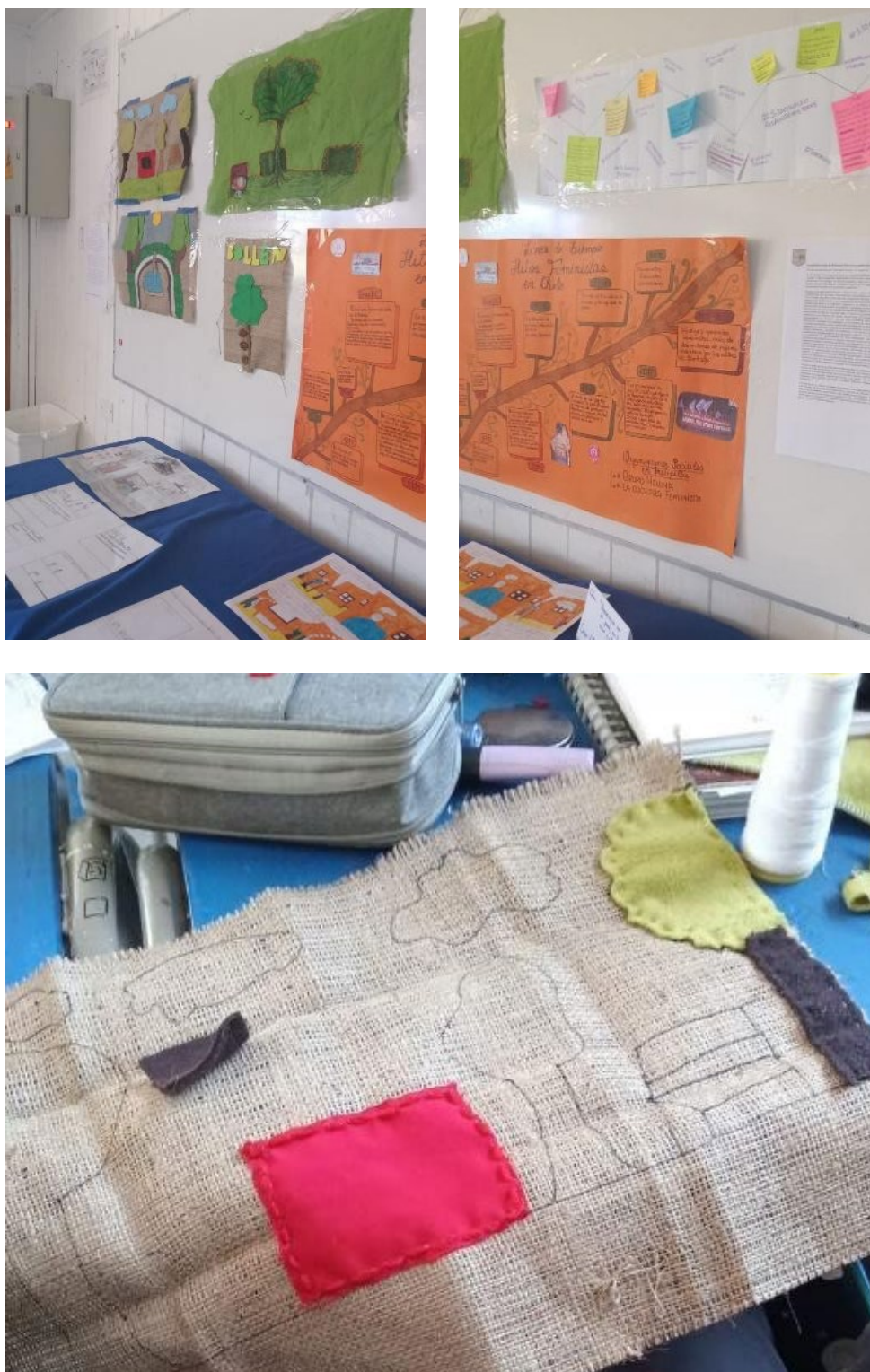
Figura 3. Proceso de elaboración y exposición de la obra.