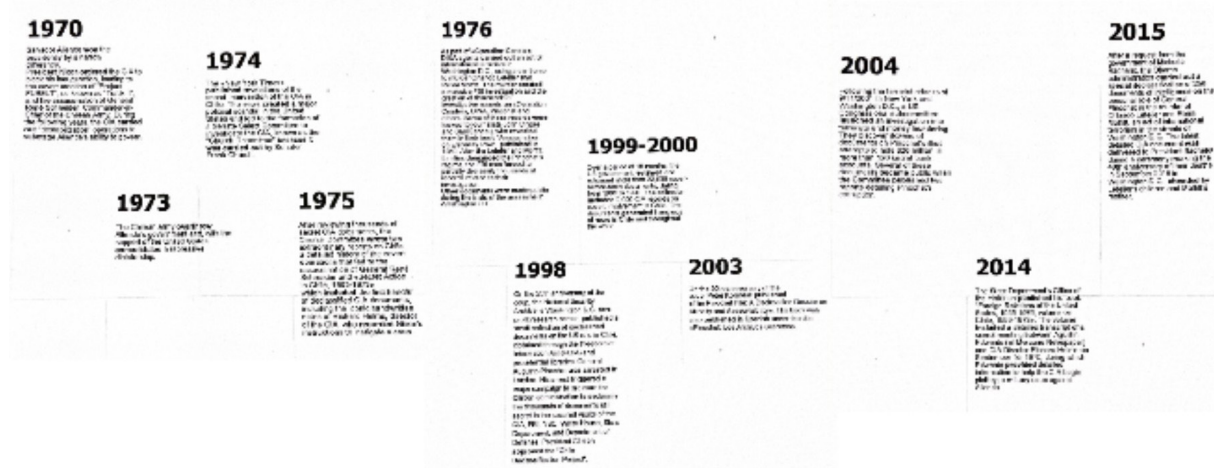
Figura 1: Cronología de la desclasificación de los archivos secretos

Nota. Elaboración propia a partir del material educativo del Museo de la Memoria y los Derechos Humanos, basado en Pinochet: los archivos secretos (Kornbluh, 2003).