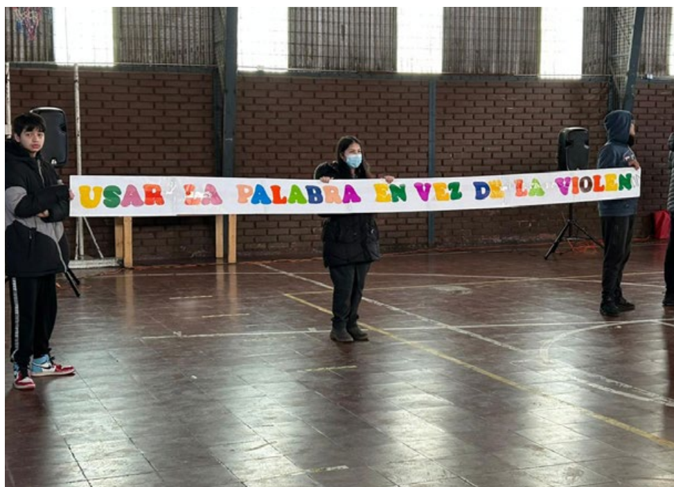
Figura 1 y 2. Actividad de cierre, Liceo Juan Bautista Pastene.