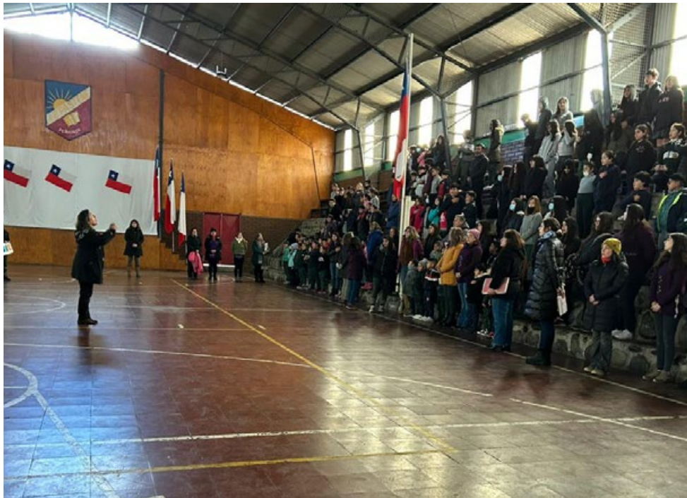
Figura 3 y 4. Actividad de cierre, Liceo Juan Bautista Pastene.