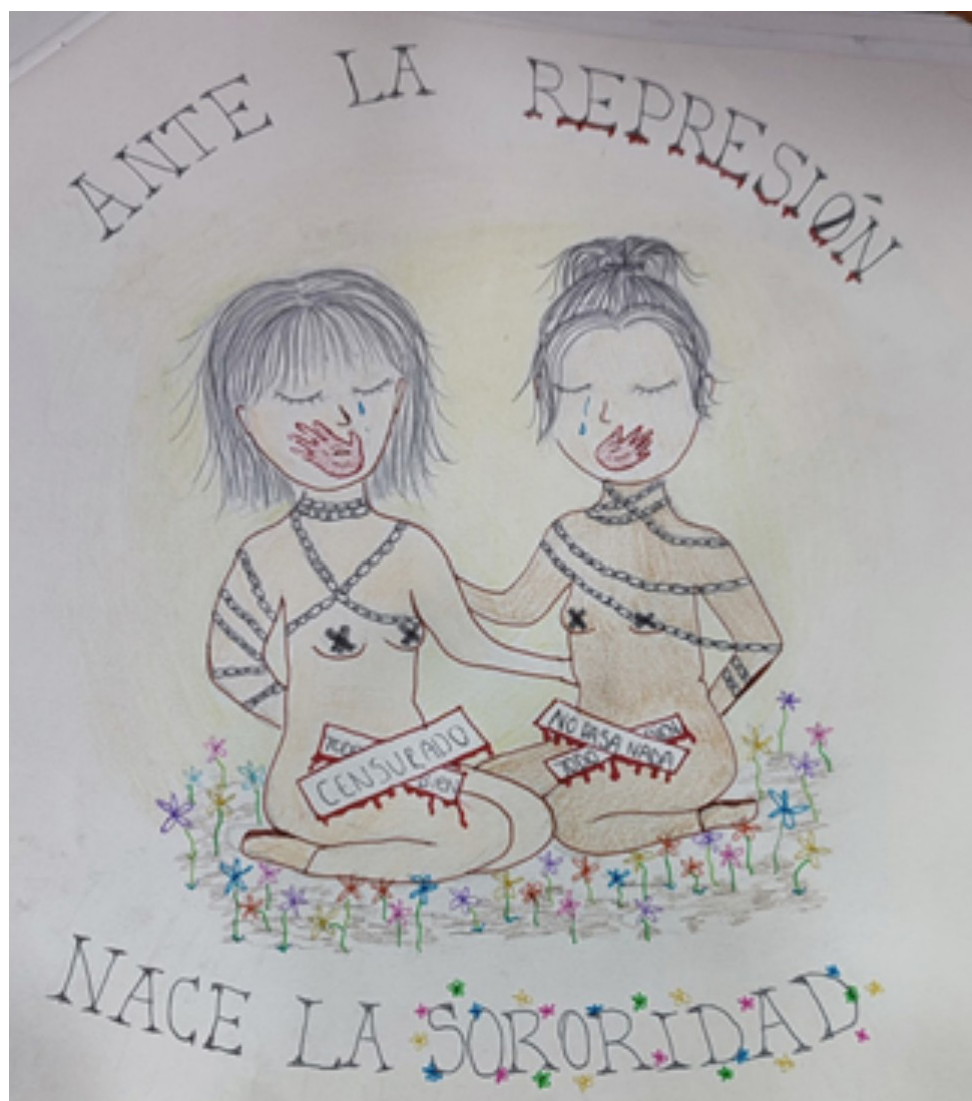
Figura 3: Ilustración artística realizada por estudiantes de III° Medio.