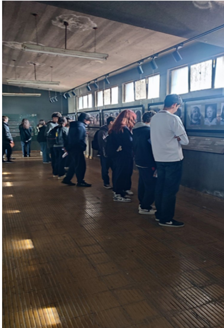
Figura 1: Visita pedagógica al Estadio Nacional, 28 de julio de 2023.