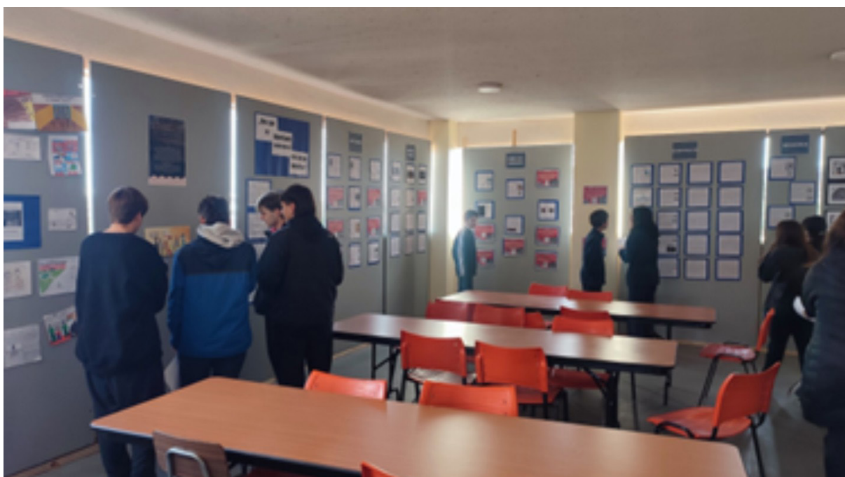
Figura 6: Instalación del “Mini Museo de la Memoria” en los pasillos del colegio durante la conmemoración del golpe de Estado en Chile.