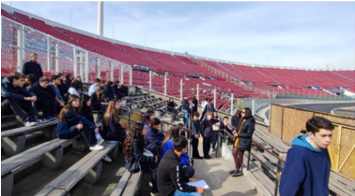
Figura 2: Visita pedagógica al Estadio Nacional, 28 de julio de 2023.