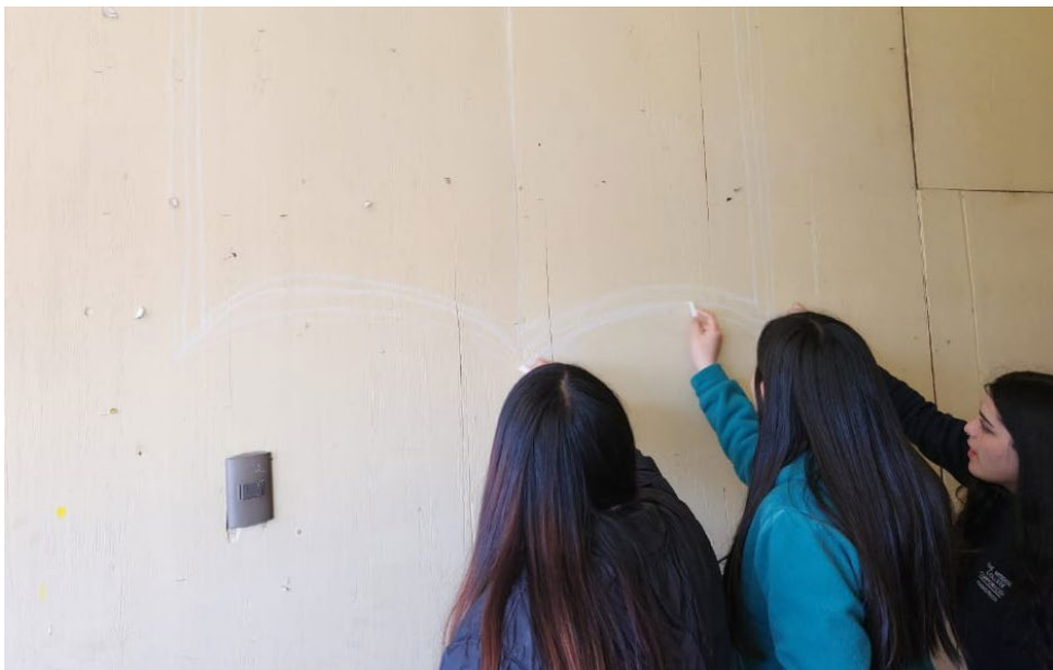
Figura 6. Proceso Pizarra N°4, Art. Registro Pablo Garnica. Lugar: Rincón Filosófico, 2° piso Pabellón Enseñanza Media TP. 2023. Voluntarias de 4° Medio C, 2023.